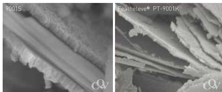
Fig 2. Comparison between SEM images of Featheleve® and normal pearlescent pigments. This unique structure of Featheleve® gives softness on touch and better higing power.